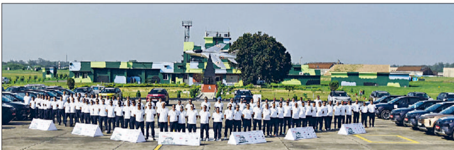
अंबाला एयरफोर्स पहुंचती यात्रा का दृश्य।