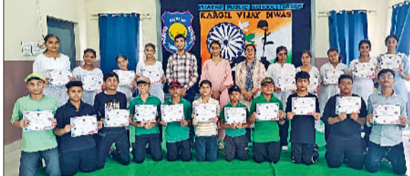
तरावड़ी। कारगिल विजय दिवस कार्यक्रम में भाग लेते प्रताप पब्लिक स्कूल के बच्चे।

प्रताप पब्लिक स्कूल के प्रांगण में आज कारगिल विजय दिवस के अवसर पर एक भावनात्मक और देशभक्ति से ओत-प्रोत कार्यक्रम का आयोजन किया गया। यह समारोह भारतीय सैनिकों के अत्यंत साहस, बलिदान और मातृभूमि के प्रति निष्ठा को समर्पित था। कार्यक्रम की शुरुआत राष्ट्र के शहीदों को श्रद्धांजलि अर्पित करते हुए की गई। छात्रों ने मनमोहन देशभक्ति गीतों, सजीव अभिनय तथा ऊर्जावान नृत्य प्रस्तुतियों के माध्यम से श्रोताओं को कारगिल युद्ध की गौरव गाथा से रूबरू कराया। मंच संचालन कर रही छात्र ने आत्मविश्वास और गंभीरता के साथ पूरे समारोह को कुशलता से आगे बढ़ाया, जिससे वातावरण पूरी