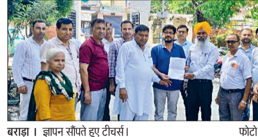
बराड़ा। ज्ञापन सौंपते हुए टीचर्स।