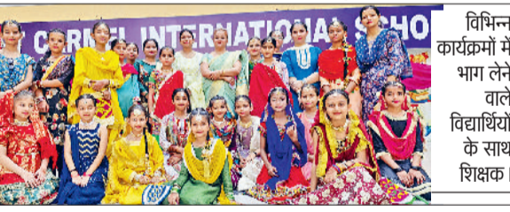
विभिन्न कार्यक्रमों में भाग लेने वाले विद्यार्थियों के साथ शिक्षक।

माउंट कार्मल इंटर-नेशनल विद्यालय, काटेमाजरा में तीज उत्सव का आयोजन किया गया। इस अवसर पर स्कूल के विद्यार्थियों द्वारा मेहंदी, भाषण, कविता, गीतों का इंटर हाउस नृत्य प्रतियोगिता का आयोजन किया गया। जिसमें विद्यार्थियों ने बह-चढ़ कर भाग लिया। कार्यक्रम की शुरुआत छात्रों द्वारा तीज की जानकारी देते हुए की गई। फिर सभी छात्र-छात्राओं ने अपने-अपने हाउस की तरफ से रंगारंग कार्यक्रम प्रस्तुत किए। विद्यालय के सभी छात्र-