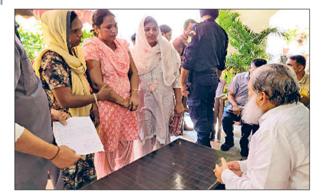
अंबाला। लोगों की समस्याएं सुनते मंत्री अनिल विज।

किशत कंपनी में जमा नहीं कराई। किशत जमा करवाने में गड़बड़ी के कारण अब कंपनी उससे 8 लाख रुपए मांग रही है। विज ने मामले में