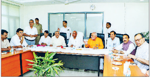
करनाल। मेडिकल कॉलेज का निरीक्षण करते विधायक।

करनाल स्थित कल्पना चावला मेडिकल कॉलेज एक बार फिर भारी लापरवाही और अव्यवस्थाओं के आरोपों में घिर गया है। शुक्रवार को हरियाणा विधानसभा की विषय समिति के निरीक्षण के दौरान अस्पताल में भारी मात्रा में एक्सपायरी दवाइयों, सेंट्रल लाइन, आईवी ड्रेसिंग किट, पंपिंग किट व अन्य मेडिकल सामग्री पाई गई। जांच में खुलासा हुआ कि कई दवाएं 2022, 2023 और 2024 में एक्सपायर हो चुकी थीं, फिर भी इन्हें स्टोर में रखा गया था। इसके अलावा यह भी सामने